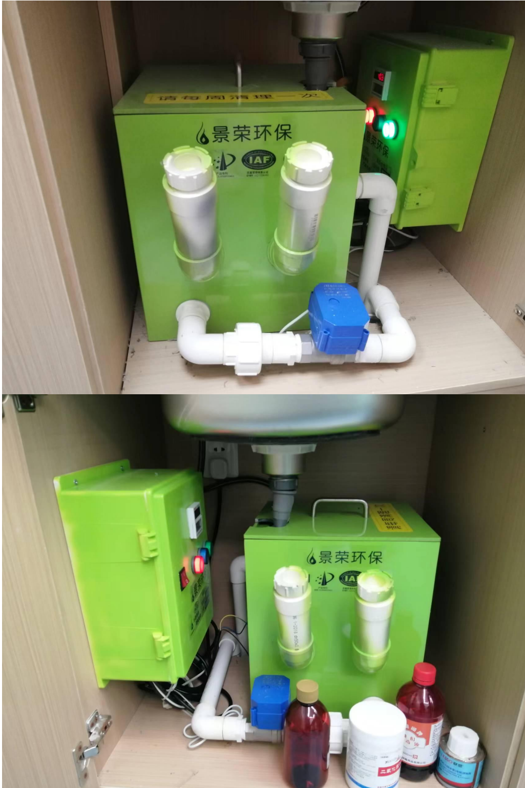
项目已安装医疗废水处理设施