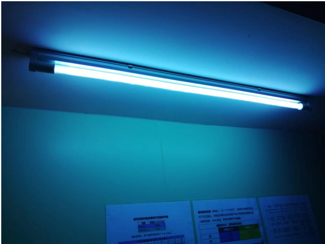
项目已安装紫外消毒灯管