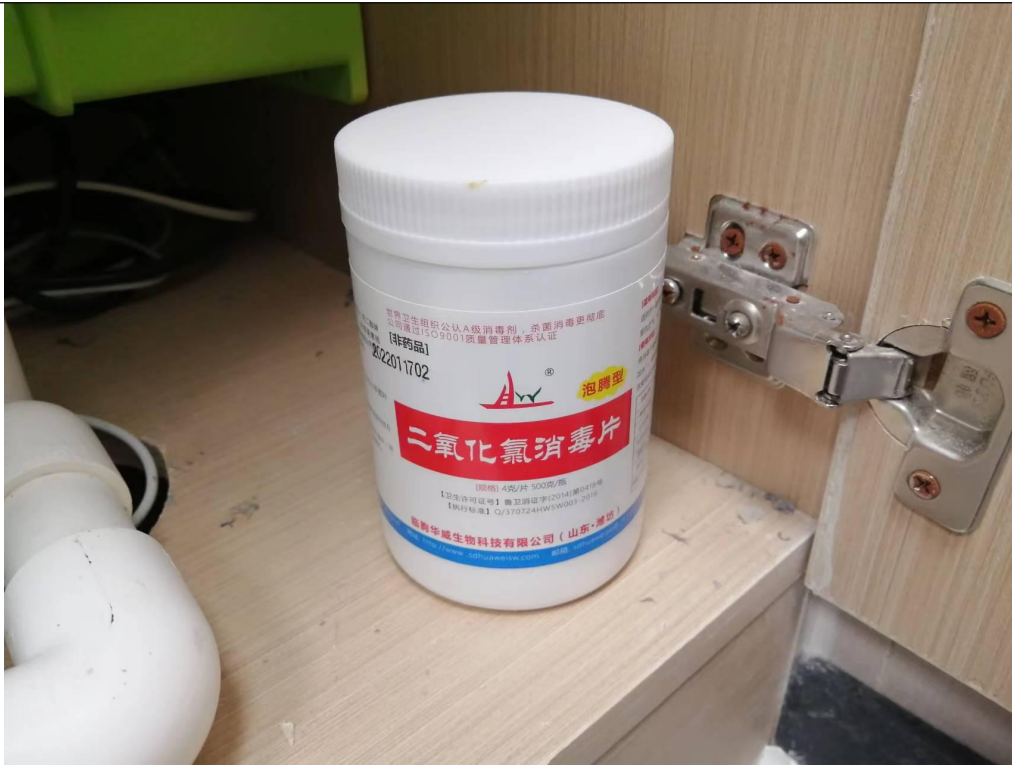
项目使用的二氧化氯消毒片