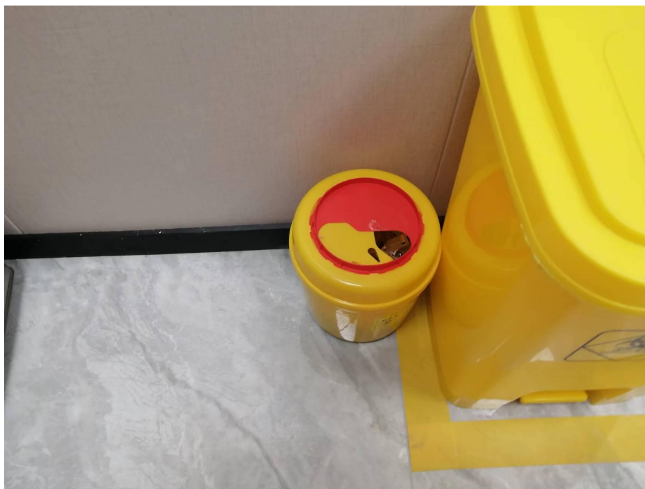
项目设置的利器盒照片