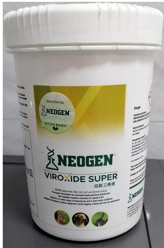
项目使用的消毒粉照片