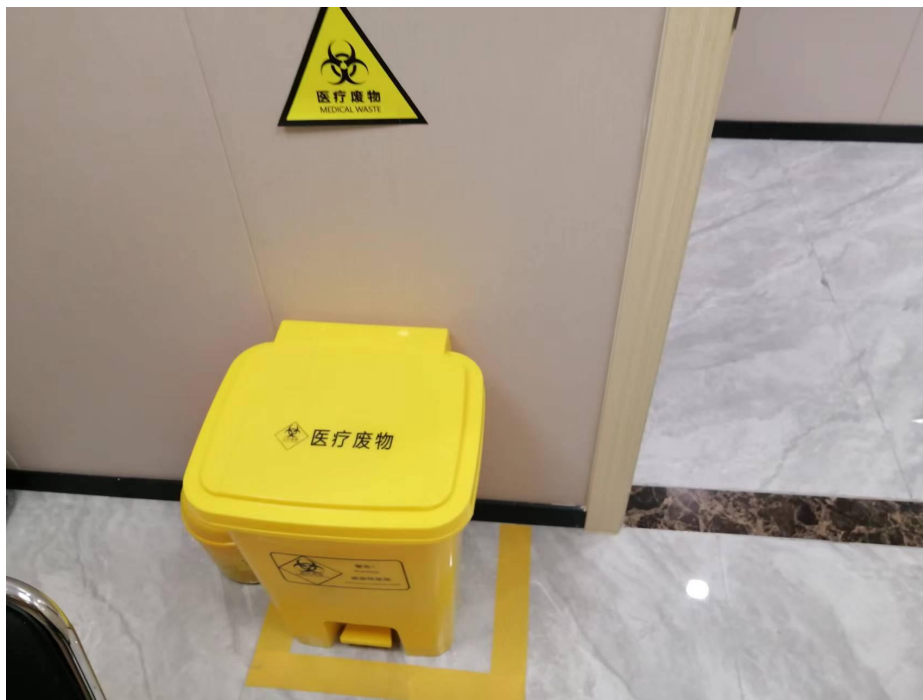
医疗废物暂存垃圾桶照片

理池的沉渣，在项目设置的医疗废物暂存桶中密闭暂存，本项目设置 1 个医废暂存桶，桶容积为 45L。产生的所有医疗废物委托深圳市益盛环保技术有限公司拉运处理处置，医疗废物处理协议见附件 4。项目设置的医疗废物暂存垃圾桶及利器盒照片见图 3-5。